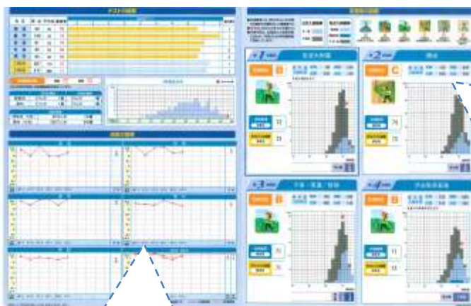
過去のデータ比較による志望校判定

小学生、中1・中2は年3回の実施、中3は年6回実施されます。1回ずつのテストにしっかり準備して臨めるように、季節講習ごとに実施しています。したがって、講習での努力の成果をみることができます。