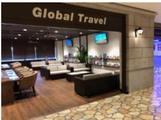
Travel Agency 旅行会社